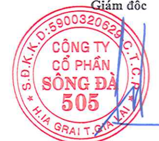
Đặng Tất Thành