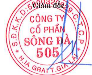
Đặng Tất Thành